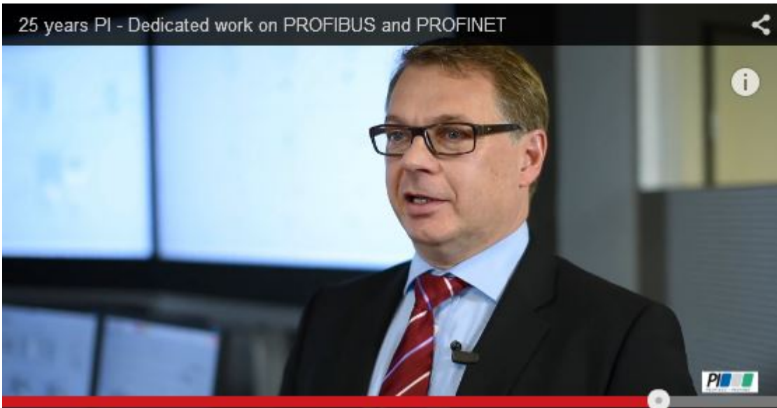
ABB hyllar PI

Som nyhetsbrev i email kommer PROFINESWS ut var tredje vecka. Som APP uppdateras den ständigt med aktuella nyheter